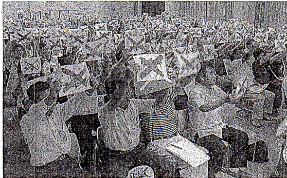
「オスプレイノー」のカードを掲げる参加者＝14日、高知県本山町