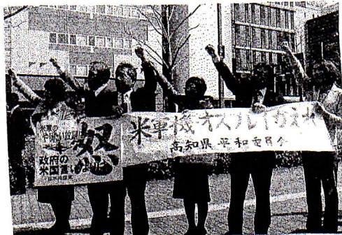
3月11日、市役所前でオスフレイ配備反対の抗議集会に県議団全員で参加しました。

今回は、高知短期大学の存続を求める方々や県部後援会のみなさんを傍聴に来て下さっていて、元気が出ました。「いつものつかちゃんとは全く別人で、本当はすごいがやねえ、次は友達も誘って行くべき」との発現に、全く別人って、とちょっと複雑な気持ちになりましたが、議会を身近に感じてもらうことが嬉しかったです。