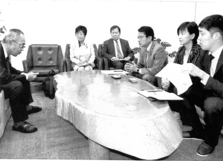
＜CLTで建てられた県森連会館にて中越会長と懇談＞

なにとするもので、各々の会長からは、市町村に専門職員がほとんどいない中、「市町村が個人の資産を管理することが本当にできるのか」「搬出の分野に企業は進出しやあいかもしないか」「切りっぱなしになるのではないかと」「外の資本が入ってき