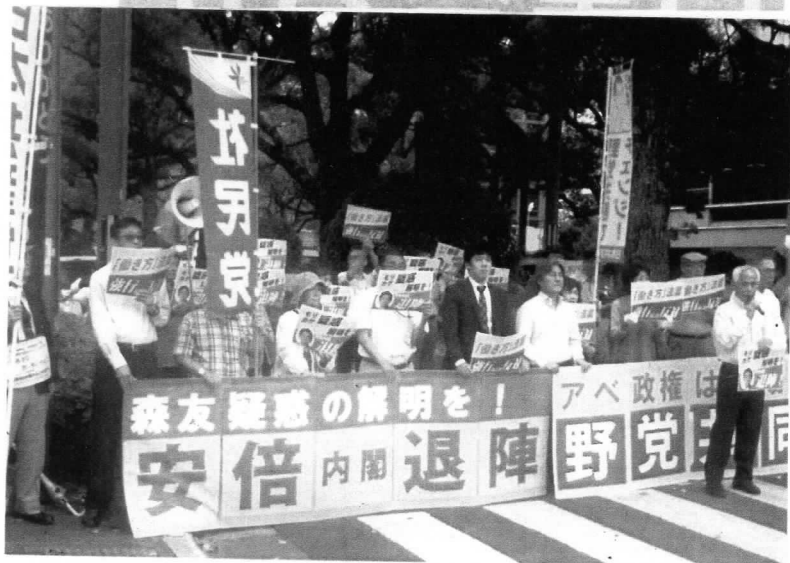
〈5月29日、市民と野党共同で行われた緊急抗議集会です〉