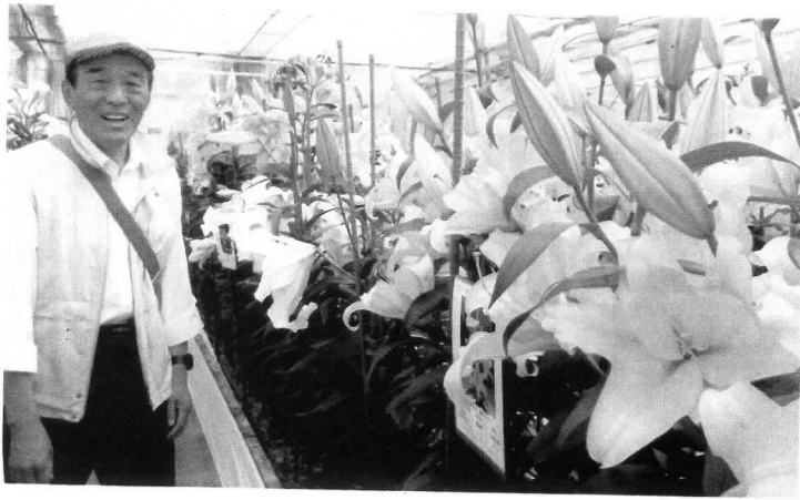
4 長浜・中村農園の「2018 ゆりフェスタ」(9日) カサハラシカはゆりの中の1品種。約500品種1万本のゆり展示会。育成、普及に努めるお話し伺いました。

▷事務所 841-2777 ▷県議会控室 823-9524 ▷自宅 841-5468 高知市長浜 5183-37