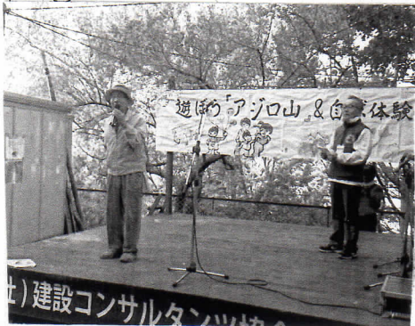
遊ぼうアジロ山 & 自然体験