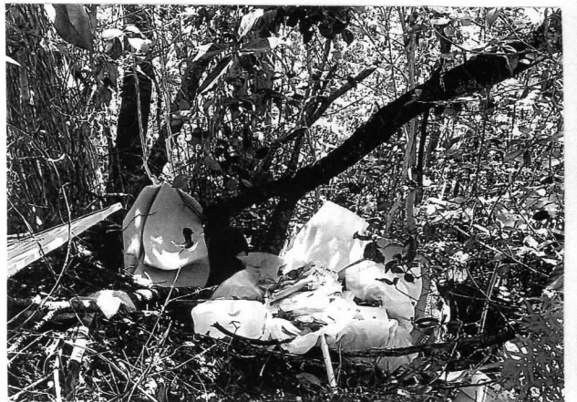
果外の業者の不法投棄。いまだにそのままです!!

高知市中心部から20分程北西にあたる旧録村の地域。毎年地域をあげて行なう、女のまつり。では中学生の意見発表や民俗文化財に指定されている大木の太刀踊のひょう、