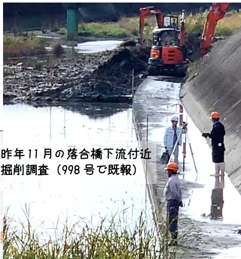
昨年11月の落合橋下流付近掘削調査(998号で既報)