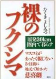
裸のフクシマ 原発30km圏内で暮らす (講談社)