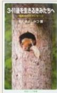
3.11後を生きるきみたちへ —福島からのメッセージ (岩波ジュニア新書)