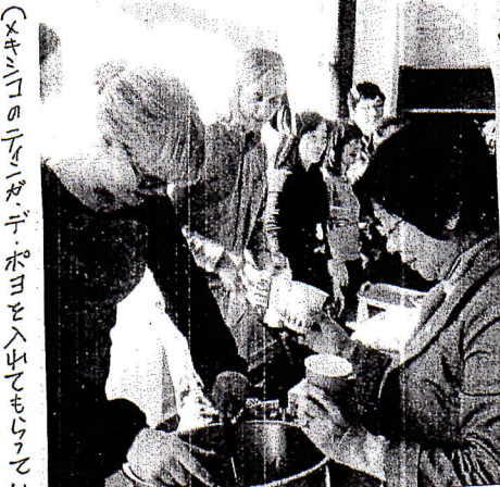
(メキシコのテラパ州ポヨをよも入れてもらっていただきます)

倉敷あいあいセンター 朝日セクター主催国際こねぐるメ大会で舌づつみ 1月26日、朝日あいあいセンターで開かれた国際こねぐるメ大会に“試合係”として参加させていただきました。地元の朝日の皆さんの方々と高知大学に留学している方々の学生さんたちが腕を競いあつたの大会。メキシコ・ホンジュラス、セルビアなど10国は味ゆえに貴重で美味し一刻でした。