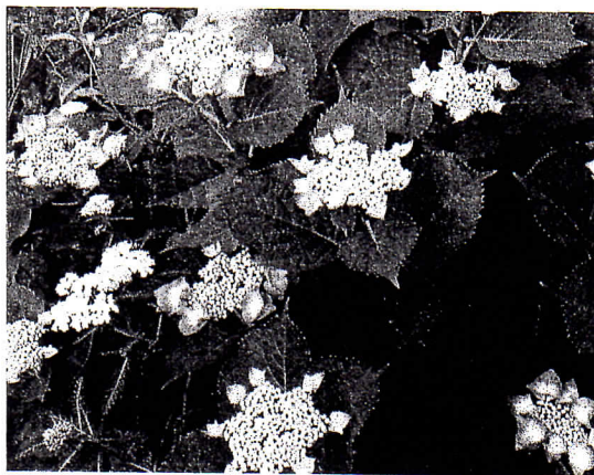
「わたしの季節」ー梅雨入りの数日前から花開いた我家のアジサイ。

県議会は 14、28日 国政選挙・参院 選直前の14日(金)から28日(金)まで開会の予定です。 暴力団問題、米軍機低空飛行、生活保護、くらし、地盤等課題です。 「意見」を積極的に お寄せ下さい。