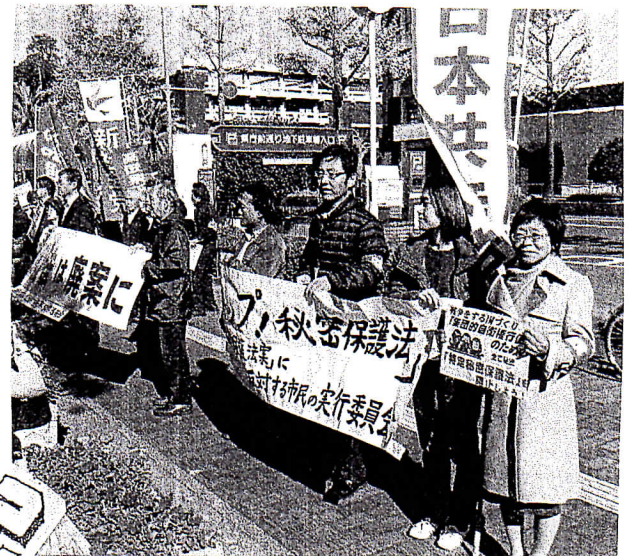
強行採決の日、市役所前で200人の抗議！