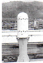
↑ 空自放射線量測定塔