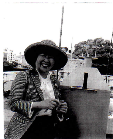
↑ 1/10ボルト エーガンター。(空気が上げ) 下は、