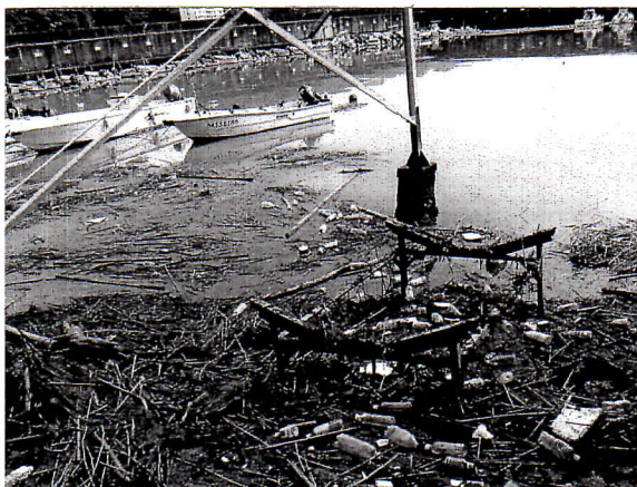
・船の係留区域にも大量の流入物