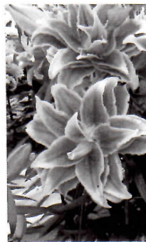
ゆりフェスタで (長浜中村農園)

の再生可能工 防炎視点等へ 作成に82万、 住民向けリーフ レーカー配布、 に延期併校、感電ハ 備等570万円（1130年 林業学校の施設整 6月議会提案は