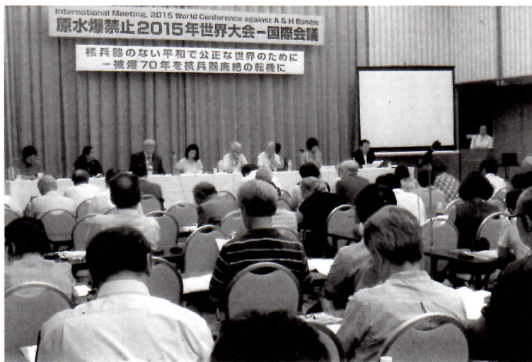
△ 広島市での国際会議(2~4日)

23日(日)には、市民集会が府 下30人が参加、母親や児童被 爆者等がアピール。安芸市(21 日)でも20人の集会和抗議行動 国会周辺10万人 全国100万人大行動に連帯 戦争をせまい、行かせない! 県民集会 パートⅡ 8月30日(月)17時からの内線地 帯にあり短時間でも――