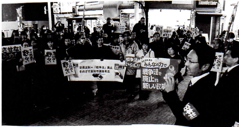
19日、中央公園北口で