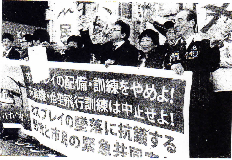
4 県議団もそろって参加 (14日)

▷事務所 841-2777 ▷県議会控室 823-9524 ▷自宅 841-5468 高知市長浜 5183-37