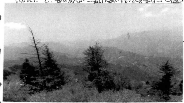
「百まで行きました。快晴の、園に下りた旭後校舎の

わたしたち、共謀罪だけは、いかんせね! 昔、とりまりの目が組合運動に向けられた時、警察の人が「OOさんは共産党やろ、教員もたつにも言わんき」など、バス停にいますよ、よてきてしくく園にいしねえ、あんまりおに子おん事は、いかん! と、母の友人が一生けんい語ってくれました。くはは、