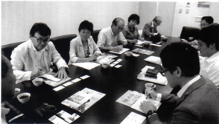
＜8月23日、JA土佐くろしおで懇談する県議団＞