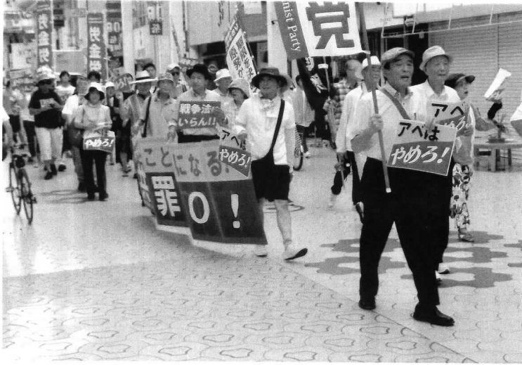
▲19日、帯屋街をデモ行進する参加者。市議・県議も。

高知市中央公園で、 戦争法（安保法制）の 廃止など、「19日行動」 が行われ約100人が参加 署名中集会、デモ行進 。こうち九条の会代表、 平和憲法ネットワー ク高知の代表、高知平和 連合会副会長が、改憲 は憲法の私物化、9条 への自任隊書き込みは 「腹違い、再び戦争遺族 を作らない、等ありさ つ。 野党4党代表も、安 倍政権打倒を訴え。