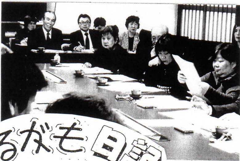
▲左端は岩城副知事 県議団もそろって参加しました(奥)