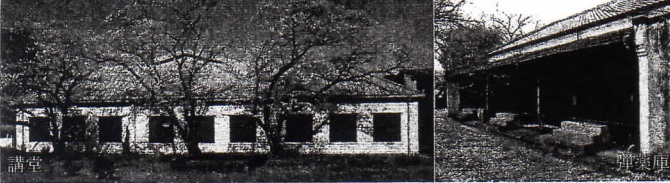
新たな段階へ！旧陸軍歩兵第44連隊弾薬庫等の保存と活用