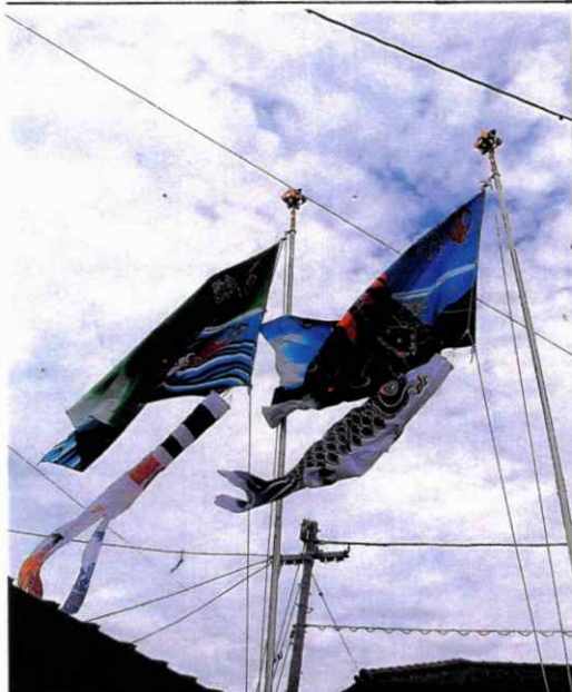
もうすぐ五月、鯉のぼり

日本共産党 高知県議会 活動報告ニュース 県議会控室 823-9524 高知市丸の内1-2-20 2020. 4. 26 自毛 872-9824 高知市福井町1475-3 No. 640