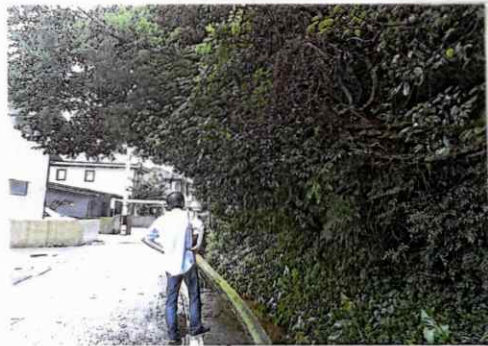
※上の写真は、7月8日の朝、朝倉米田の水路沿いの市道に倒れてきた樹木。下は、7月11日付近にある猪下しやうの場所。