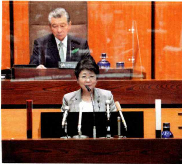
3月22日、県議会開会日の本会議場にて

個別策を行わず、家族経営体農業を守る施策が貧弱なこと、オノは、グロバル化の推進、インバウンド観光路線を踏襲し大阪のカジノも含むIRに期待しても表明していることと見過ごせません。コロナパンデミックは、医療・介護・保育など、国内生産の重要な社会、経済の根本的見直しが必要となることになりました。政府がそのことと正面から受け止めること、が何より重要です。