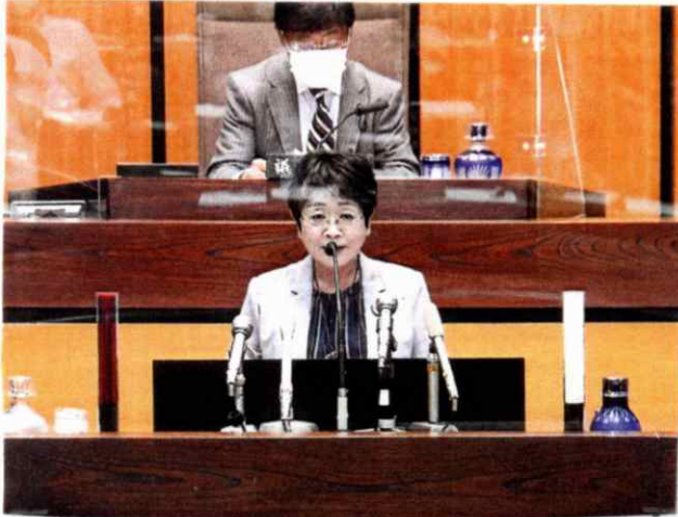
県議会本会議場、白く光っているのは、パネーションです