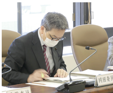
商工農林水産委員会