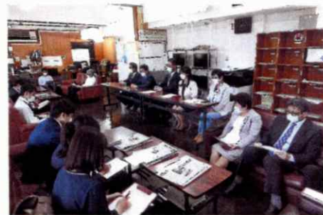
※ 4月25日 県政記者室にて