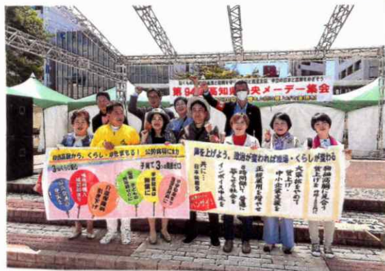
ステージで、市議団の皆さんと!