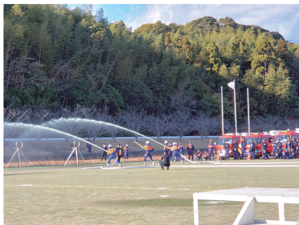
南国市消防新春出初式（三和琴平の流通団地）

7日の南国市消防新春出初式に出席しました。元日の午後4時過ぎに石川県能登地方でマグニチュード7.6、最大震度7の大地震と津波がありました。亡くなられた方々のご冥福をお祈りします。被災された皆さんにお見舞い申し上げます。今年の出初式は、被災地の方々に思いを寄せると共に、一方で「明日は我が身」という緊張感のある出初式となりました。4日には林業関係者の土佐緑友会の賀詞交歓会が高知市のクラウンパレス新阪急で開かれ出席しました。